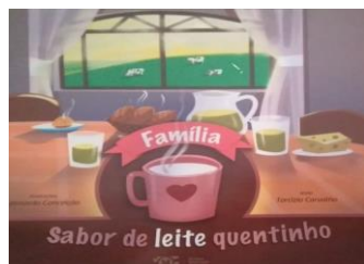
TARCÍZIO CARVALHO 1º BIMESTRE

Os livros literários do 1º bimestre, 2º bimestre e 4º bimestre estarão disponíveis na escola para locação; o livro literário do 3º bimestre deverá ser adquirido em livrarias, biblioteca pública ou arquivo PDF (internet).